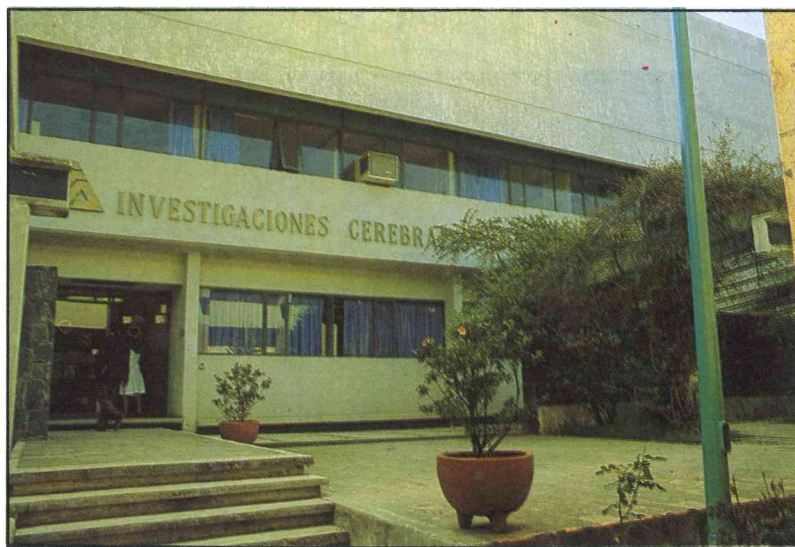
En México el estudio de la mente se encuentra al nivel de los países primermundistas