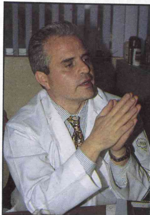
Doctor Julio Sotelo

al ritmo de investigaciones motivadas por aquel descubrimiento. Cada hallazgo nuevo hace que los investigadores ajusten y modifiquen sus programas de investigación y los orienten con base en ese conocimiento reciente.